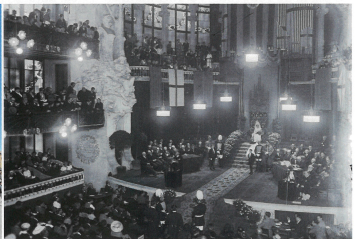
Façana de la seu modernista del Palau precedida per l'espai del Petit Palau annexe, avui. A la dreta, imatge de l'acte dels Jocs Florals de 1935, al mateix recinte, el dia en que es guardonà Perarnau.

Les dates del diumenge 26 de maig de 2024 i el diumenge 5 de maig de 1935 són separades per vuitanta-nou anys gairebé clavats.