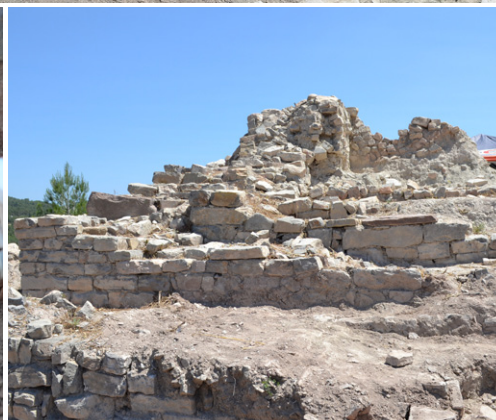
Participants en la 9a Campanya d'Excavació Arqueològica, a la imatge superior A sota, treballs a l'antiga necròpolis de l'església i restes de la torre del Puig de Sant Pere