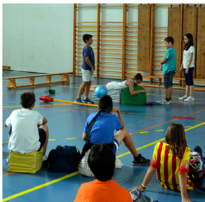
Activitat del programa 'El Juliol tot ho vol'

El programa 'El Juliol tot ho vol' ha tingut enguany una participació de 141 infants. L'organització va anar a càrrec de la Societat Atlètica de Súria (SAS) i de les àrees de Joventut i Benestar Social de l'Ajuntament, amb la col·laboració de l'Agrupació Sardanista, l'Agrupament Escolta Joan Ros, Ampans, la Biblioteca Pública, la colla castellera Salats, el Consell Municipal de la Gent Gran i el Foment Cultural.