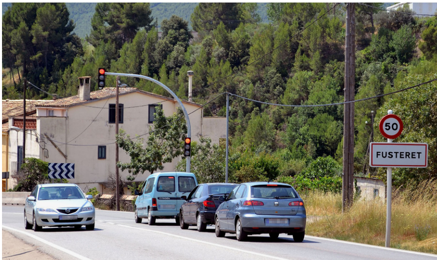
Vehicles aturats davant un dels semàfors instal·lats al barri de Fusteret

L'Ajuntament va demanar la col·locació dels aparells a la direcció general de Carreteres