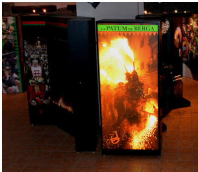
Exposició a Cal Balaguer del Porxo

L'Oficina de Turisme i la sala Cal Balaguer del Porxo han modificat els seus horaris, de forma que els dies d'obertura van ara de divendres a diumenges i festius. Els canvis també afecten les visites guiades al Poble Vell i al Castell, que han de ser concertades amb una antelació mínima de 48 hores. Els canvis han estat motivats per la necessitat d'optimitzar els recursos dels serveis municipals. Els nous horaris són els següents: