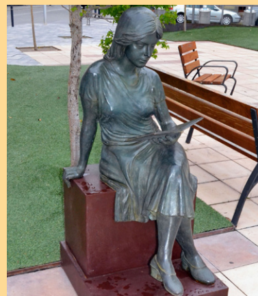
Escultura a la plaça de la Serradora