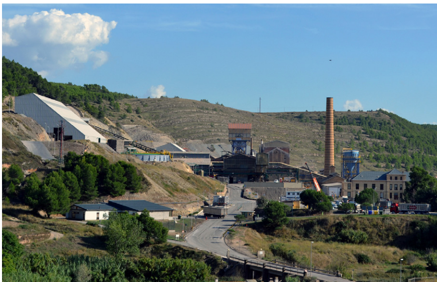
Vista exterior de les instal·lacions centrals de l'empresa minera Iberpotash

La modificació de les Normes Subsidiàries afecta el sector industrial Estació (PE-11)