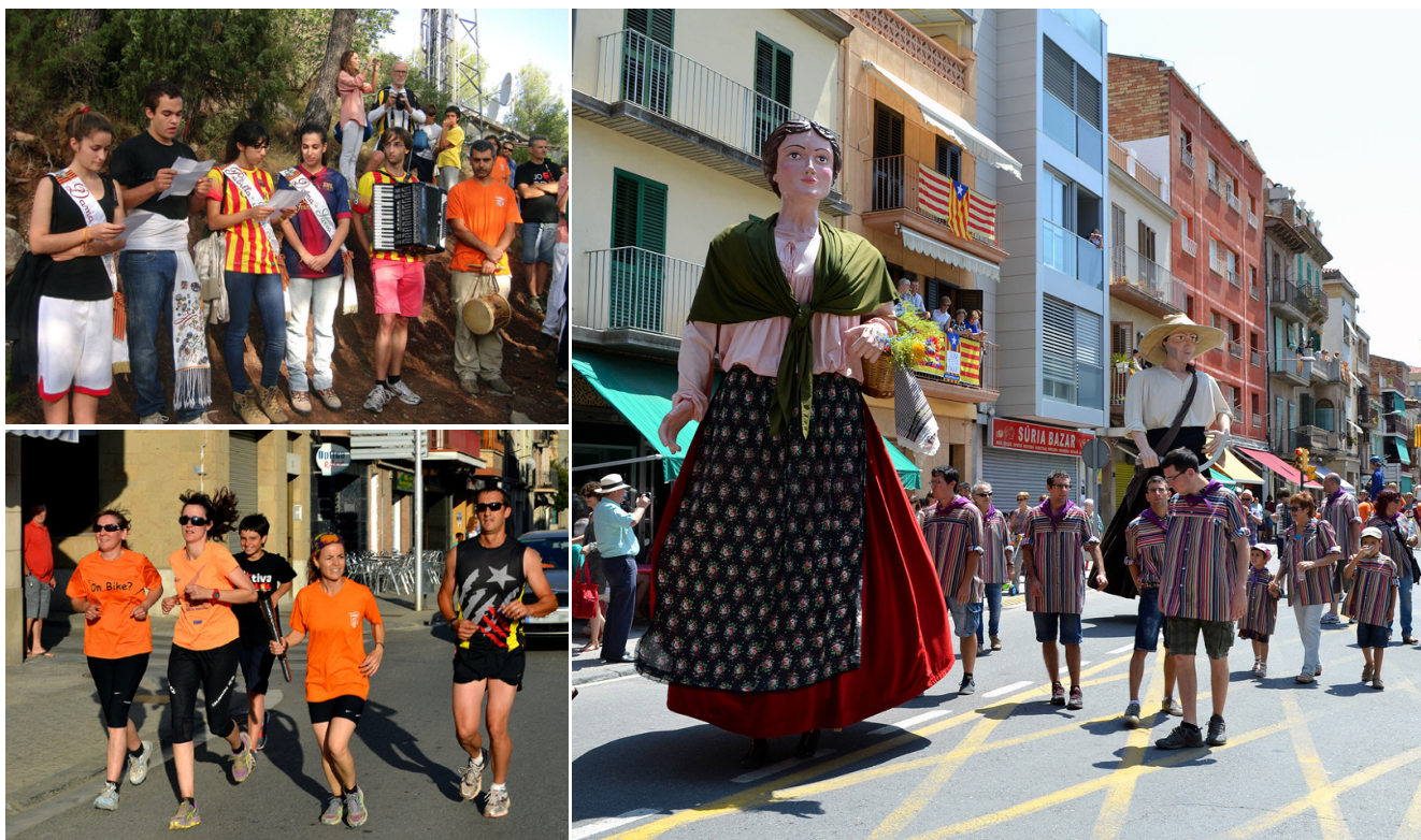
Imatge de la cercavila de la Festa Major, amb els gegants del Gorg de l'Olla, al seu pas pel centre urbà, a la dreta La pubilla, l'hereu i les dames d'honor llegeixen el manifest de l'Onze de Setembre (dalt), i arribada de la Flama del Canigó a Súria