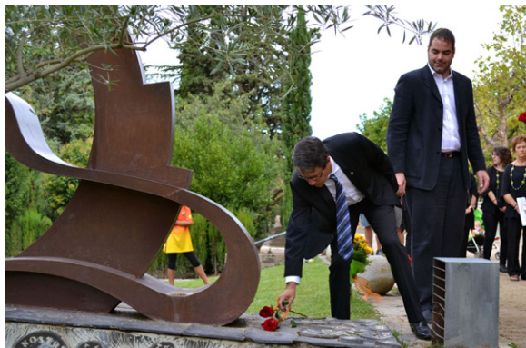
Ofrena floral de l'alcalde en l'acte de la Diada a Sallent

Nit de Sant Joan. Súria va celebrar la tradicional revetlla amb un ampli programa d'activitats. Com en anteriors edicions de la festa, la Flama del Canigó va ser portada a la vila per corredors i corredores de Súria que, enguany, també van portar aquest símbol dels Països Catalans des de Manresa fins a Sant Joan de Vilatorrada i Callús.