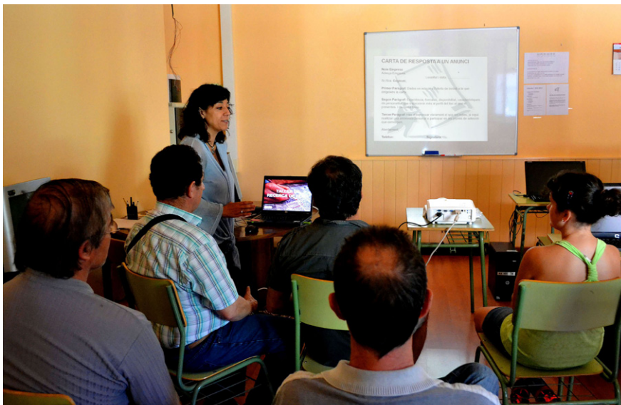
Sessió formativa del programa 'Treball als barris', celebrada al Club de la Feina La iniciativa ofereix un assessorament personalitzat en la recerca d'una nova ocupació

L'àrea de Desenvolupament Local de l'Ajuntament va portar a terme durant el primer semestre la primera fase del programa 'Treball als barris', adreçat a persones del Poble Vell o del barri de Sant Jaume que estiguin en situació d'atur o vulguin millorar la seva situació laboral. El programa tindrà continuïtat en els propers mesos, amb noves accions de suport a aquest col·lectiu.