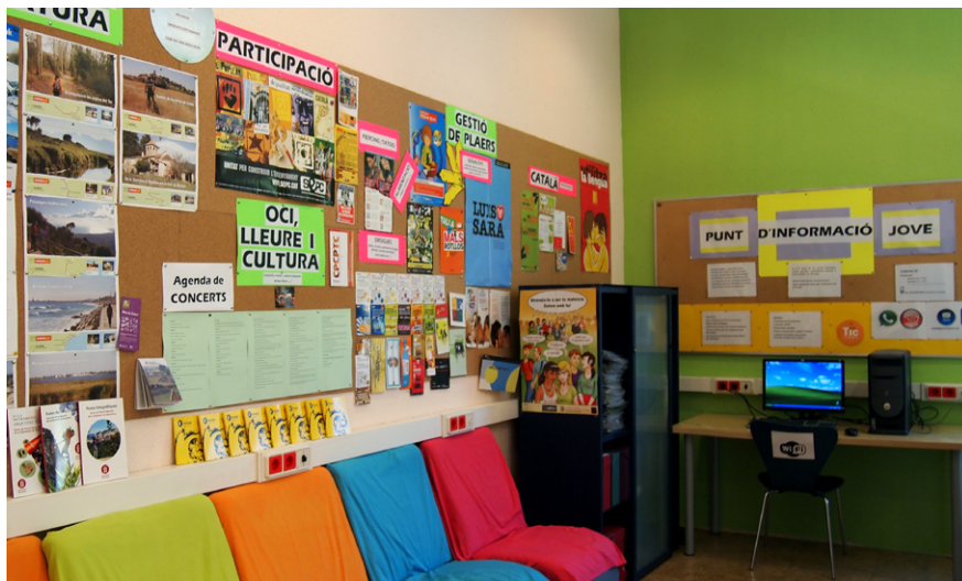
Interior del Punt d'Informació Jove, ubicat a la sala petita del Casal de Joves

El servei ofereix informació i assessorament gratuït i confidencial sobre temes d'interès