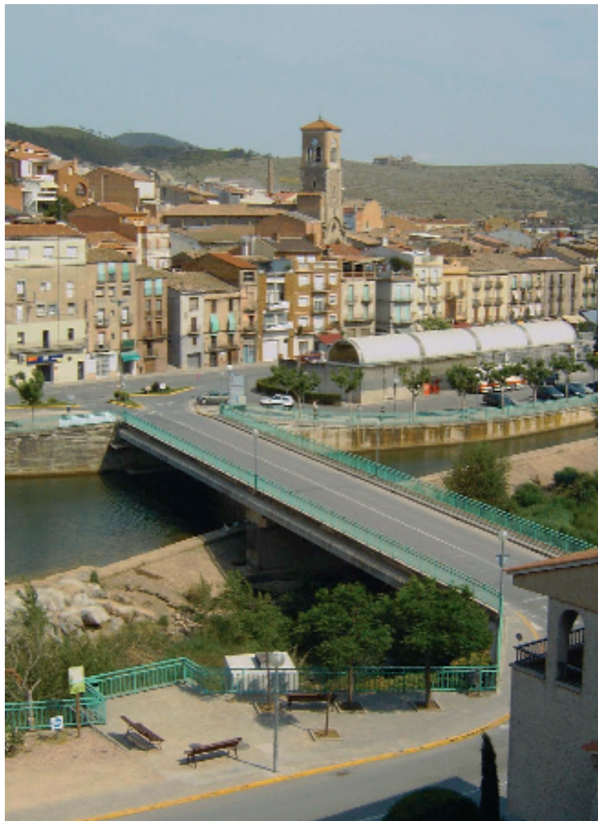
La vorera del Pont Nou s'eixamplarà tres metres i es renovarà l'estació d'autobusos.

Tot el tram de la carretera, entre la cruï-