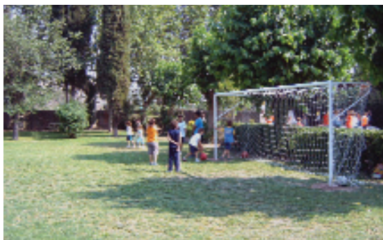
El nou equipament acull un camp de futbol 7