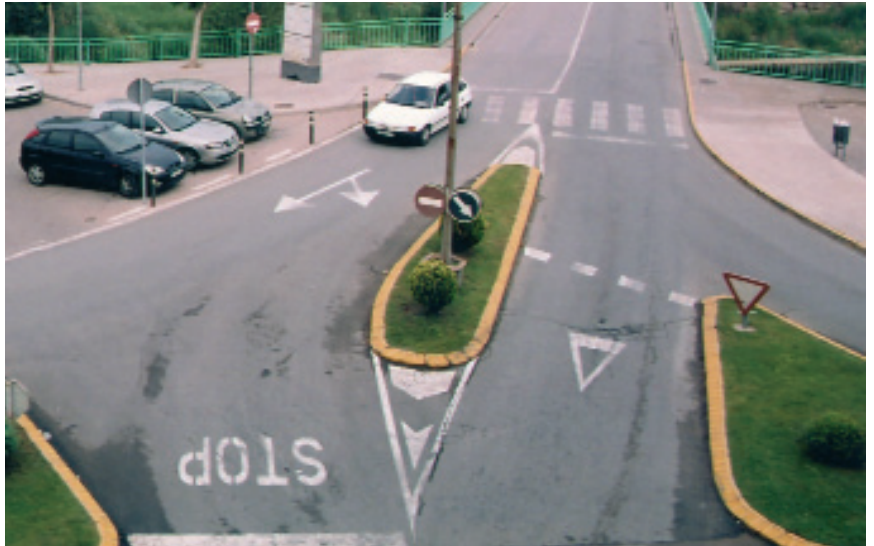
L'actual cruïlla del pont de Salipota serà objecte de renovació

Tota la carretera de Súria serà zona d'una important transformació en les obres que es faran en els propers mesos. Millorar la mobilitat i seguretat de vianants i vehicles és l'objectiu principal d'aquesta actuació, que modernitzarà notablement el centre neuràlgic de la vila. Les obres agafaran diferents sectors: el pont de Salipota, la cruïlla de la carretera amb el pont, l'estació d'autobusos i tot el tram de carretera des de la cruïlla amb la carretera de Balsareny fins a Cal Trist