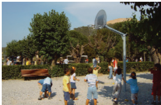
Bàsquet del parc municipal del Casino

En aquest complex lúdic, també hi ha servei de bar-cafeteria, casal de joves i dues pistes de tennis.