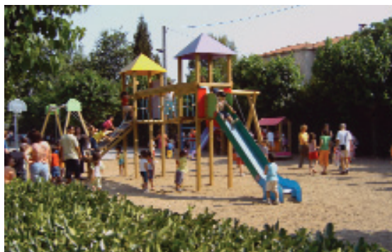
Els més petits poden gaudir al nou parc infantil