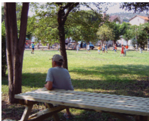
El Casino també acull una àrea de descans.