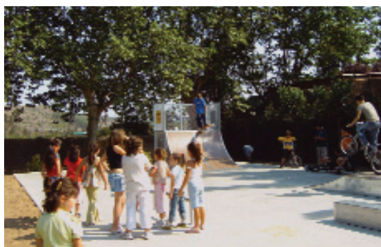
Per als joves també hi ha una pista de monopatins